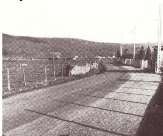
La rue du Bois, doublée en largeur

La décennie voit aussi l'idée d'une voie rapide qui évite les villages commencer à s'imposer. Car à Boeil-Bezing, par exemple, les bouchons sont quasiment quotidiens, en particulier à 17 heures, quand les troupeaux de vaches revenant du champ croisent la ribambelle des cars de Turboméca ! Dès 1976, un premier tracé Pau-Igon est étudié. En prévision, la rue du Bois est doublée à la sortie du village.