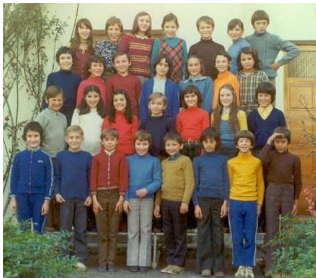
La classe de CM2 de 1974-75 à 29 élèves !

Comme la population augmente, l'école, pourtant agrandie en 1960, devient déjà trop petite. On construit donc le préfabriqué en 1971, puis deux classes supplémentaires jusqu'au bord de la rue de l'Eglise en 1973. L'école compte à cette époque près de 150 enfants, avec des cohortes frisant les 30 élèves.