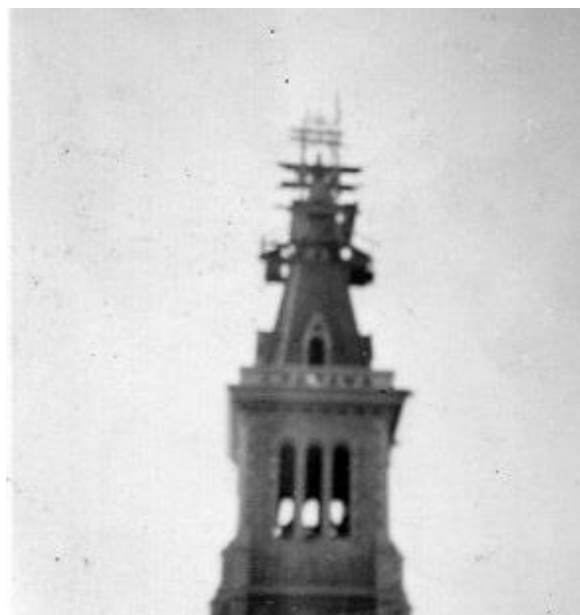
La flèche du clocher en cours de reconstruction

Le 1 er décembre 1976, une forte tempête endommage les toitures et emporte plusieurs flèches de clochers (dont celle de Lagos). Celle de Boeil-Bezing ne tombe pas mais, trop endommagée, elle devra être remplacée par celle que nous connaissons, en béton armé.