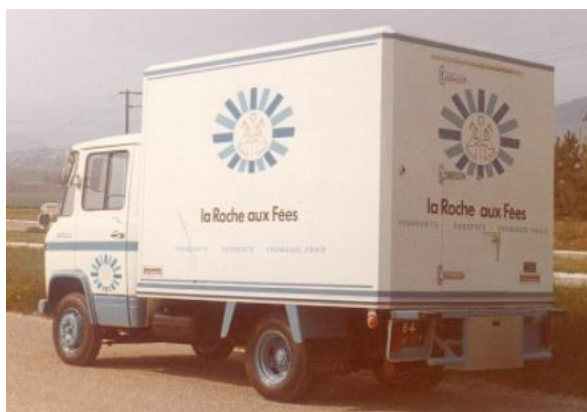
Camion de livraison La Roche aux Fées

La laiterie « La Roche aux Fées » est à son apogée. Forte de ses 4 usines de production dont celle de Boeil-Bezing, la marque de yaourts du groupe Unilever rivalise dans les rayons avec Yoplait et Danone. Sa politique commerciale du gadget (figurines, images, mini-jouets... accolés aux lots de yaourts) lui vaut un franc succès. L'usine de Boeil-Bezing emploie plus de cent personnes. Elle expédie des yaourts vers tout le quart sud-ouest, des petits suisses et fromages frais vers un tiers ouest de la France et des mousses au chocolat vers tout le pays. En plus des camions de livraison, chaque soir à 19 heures, un long semi-remorque traverse lentement le village en direction des plates-formes de distribution et domine, du souffle superbe de ses soupapes pneumatiques, le ronronnement familier des trayeuses en action dans toutes les fermes.