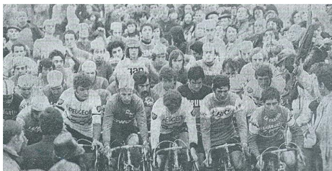
Bernard Thévenet (à g. maillot Peugeot) au départ du cyclo-cross en 1974

La laiterie « La Roche aux Fées » est à son apogée. Forte de ses 4 usines de production dont celle de Boeil-Bezing, la marque de yaourts du groupe Unilever rivalise dans les rayons avec Yoplait et Danone. Sa politique commerciale du gadget (figurines, images, mini-jouets... accolés aux lots de yaourts) lui vaut un franc succès. L'usine de Boeil-Bezing emploie plus de cent personnes. Elle expédie des yaourts vers tout le quart sud-ouest, des petits suisses et fromages frais vers un tiers ouest de la France et des mousses au chocolat vers tout le pays. En plus des camions de livraison, chaque soir à 19 heures, un long semi-remorque traverse lentement le village en direction des plates-formes de distribution et domine, du souffle superbe de ses soupapes pneumatiques, le ronronnement familier des trayeuses en action dans toutes les fermes.